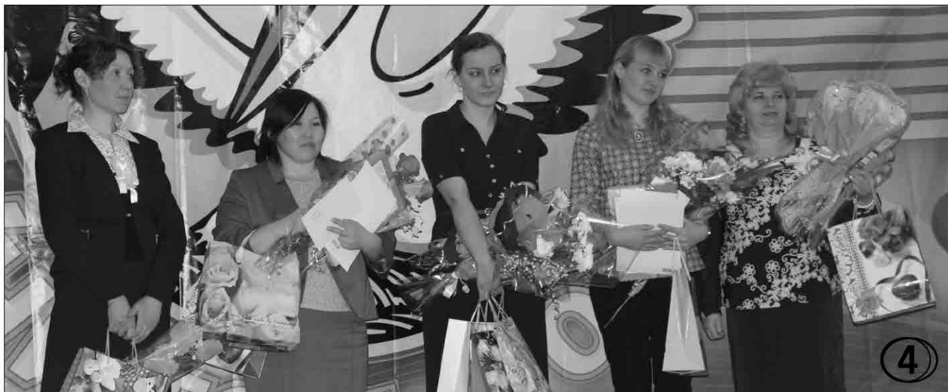
Пять педагогов из пяти школ района приняли участие в традиционном конкурсе «Учитель года»