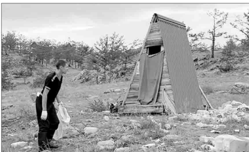
Таких свалок на берегах Байкала в последние годы очень много. Причем пока волонтеры и экологи их активно убирают, туристы, да и местные жители, снова наполняют отходами

— Давно назрела необходимость в принципиальном сокращении объема коммунальных отходов, вторичной переработке мусора и предоставлении возможности раздельной утилизации отходов. По-прежнему продолжаться не может, мы просто зарастем мусором. Хорошо, что хотя бы сейчас власти обратили внимание на проблему. Этому можно только порадоваться и способствовать реализации программы. Конечно, придется приложить усилия,