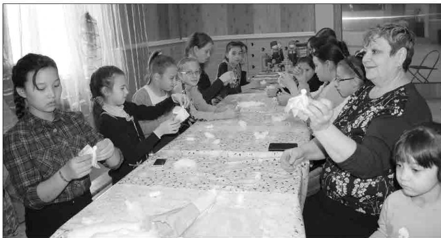
Пятиклассники изготавливают кукол-ангелочков

Для младших школьников в фойе Центрального дома культуры специалисты Центра русского языка, фольклора и этнографии провели мастер-классы по изготовлению кукол-ангелочков и по модельному конструированию берестяных игрушек, в нашем случае свистулек. На встрече много говорили и об исключительных чело-