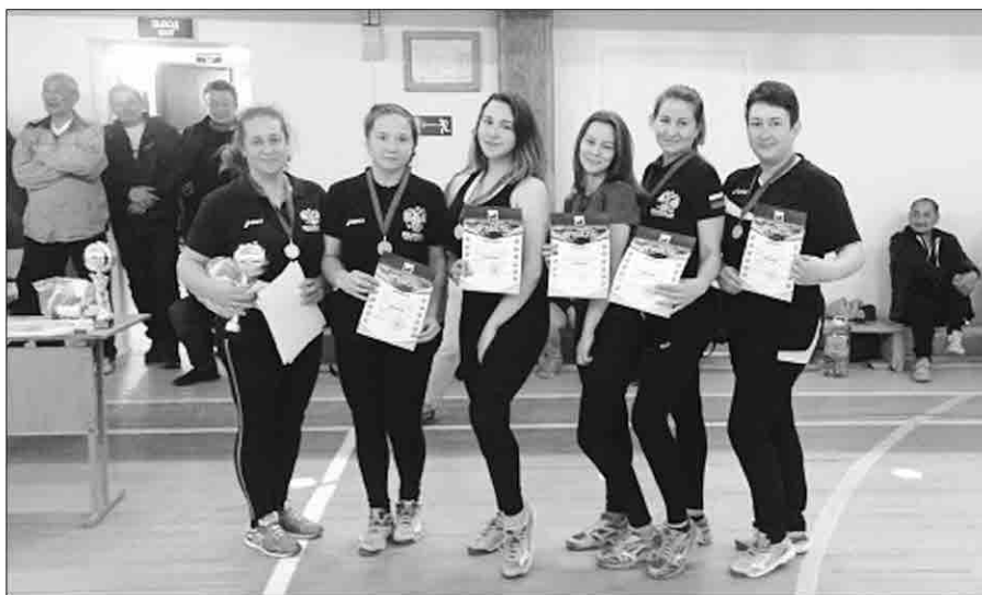
Качугские волейболистки - победительницы турнира

Принять участие в турнире «Золотая осень» в этот радостный субботний день приехали 16 команд: 7 женских и 9 мужских. На площадке собрались как спортсмены Качугского района, так и соседних - Жигаловского и Баяндаевского. Впервые на соревнованиях выступила команда села Залог, представив мужскую и женскую команды. Надеемся, «Золотая осень» в будущем будет принимать больше новых участников. Присоединяйтесь к нам!