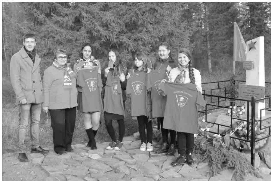
12 октября на открытии обелиска Ивану Большедворскому в комсомол приняли пять качугских девчат

Комсомолом накоплен большой опыт во многих сферах государ-