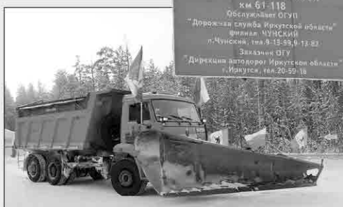
18 декабря 2017 года. Торжественное открытие дороги Тайшет — Чуна — Братск. Новая трасса сократила путь от Чуны до Братска на 250 километров. В 2018 году на реализацию государственных программ в сфере дорожного хозяйства предусмотрено около 9 миллиардов рублей