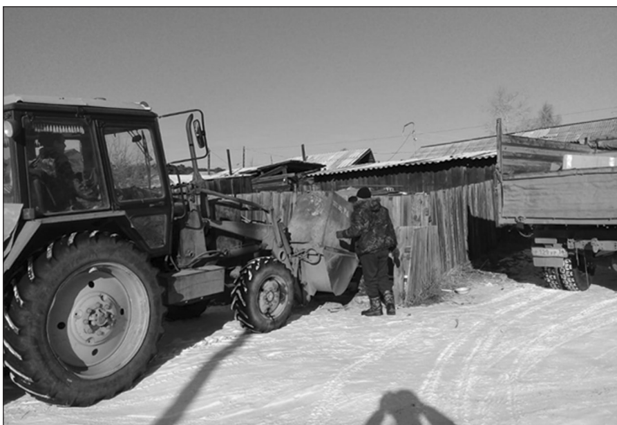
Старт мусорной реформе в Качуге будет дан после установки новых площадок под сбор ТКО, а пока администрация поселения регулярно и бесплатно вывозит мусор от многоквартирных домов качугцев

- Согласен, и органы местного самоуправления, считаю, на сегодня не готовы реализовать реформу в том виде, в каком ее представляют наверху. В большой цепи полномочий на каждый субъект исполнительной власти возложены свои обязанности. Регион, к примеру, отвечает за выбор компании, которая занимается сбором и утилизацией ТКО, так называемого регоператора. Для всех жителей нашего района на сегодня правительством области определен региональный оператор, компания «РТ-НЭО Иркутск». Администрация городского поселения, согласно принятому федеральному закону, со своей стороны обязана создать в Качуге контейнерные площадки для сбора мусора. И только после того, как площадки будут установлены, к нам на территорию зайдет регоператор для предоставления услуги по вывозу мусора. Именно с этого момента людям от регоператора начнут приходить квитанции на оплату. Хотел бы подчеркнуть, взимать плату за вывоз мусора будет именно компания-регоператор, предоставляю-