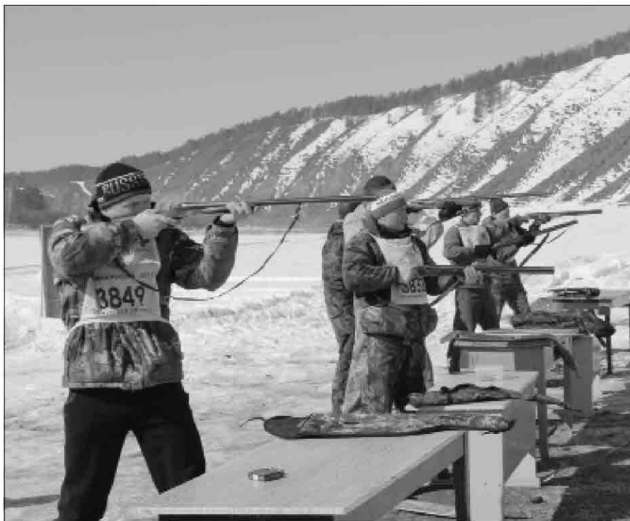
На огневом рубеже последнего этапа эстафеты

мишеней, вновь завоевав титул самого меткого охотника-биатлониста.