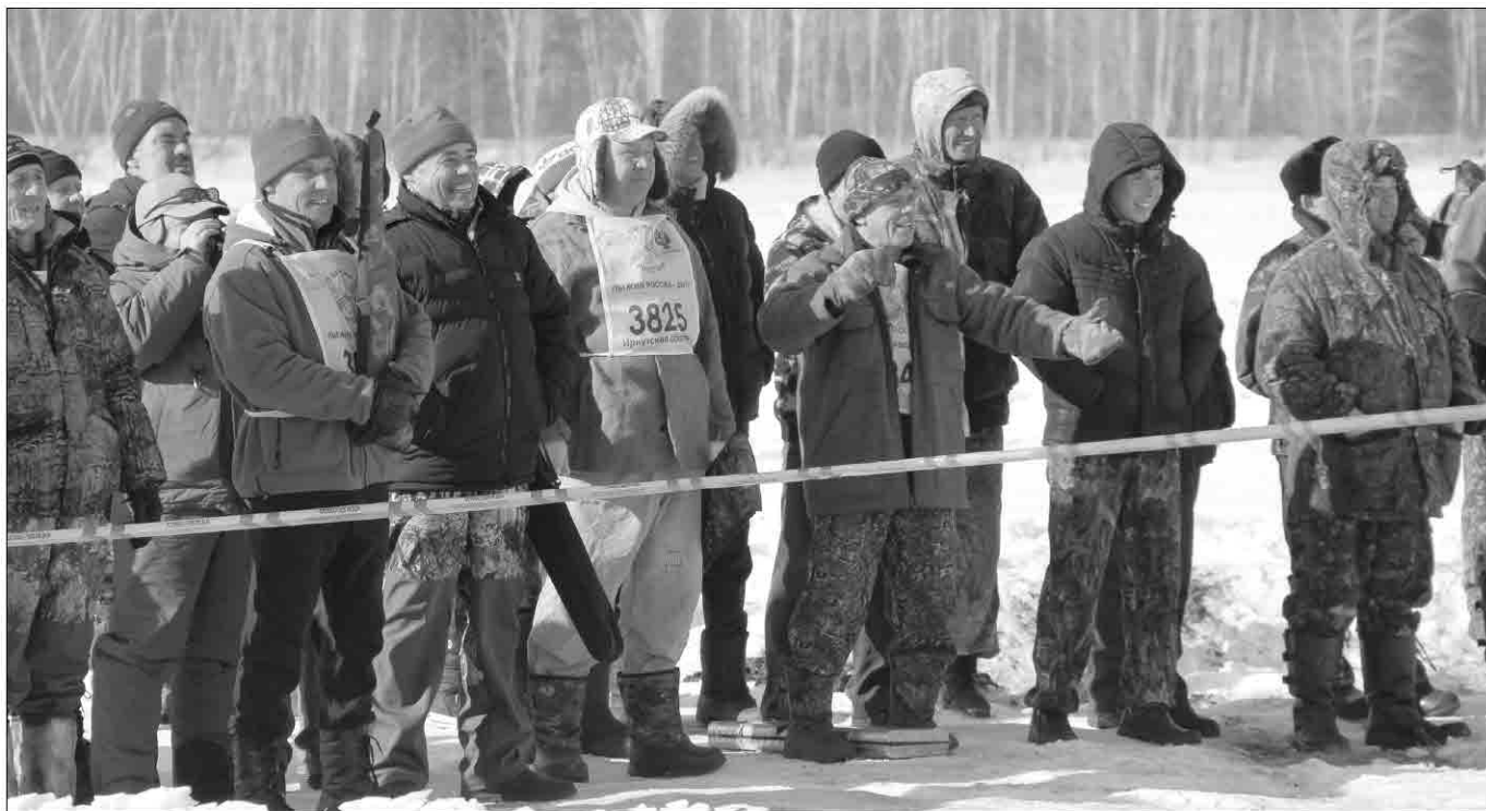
Болеющим приближаться к стрельбищу запрещено