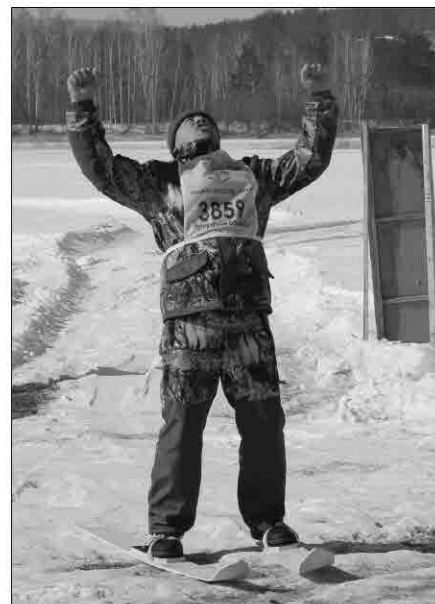
Охотника не расстреляли, охотник рад завершению эстафеты