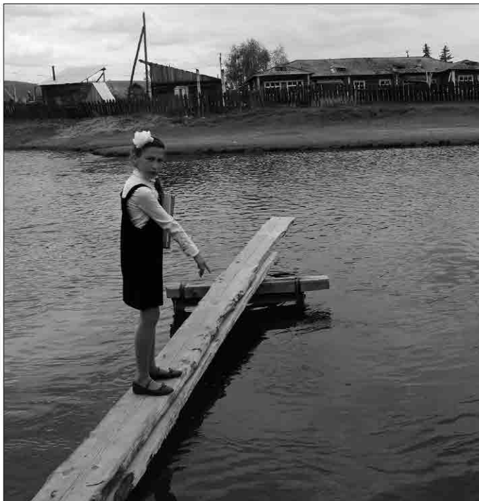
Нырляка в любое время года излюбленное место бирюльской ребятни. Здесь все и случилось