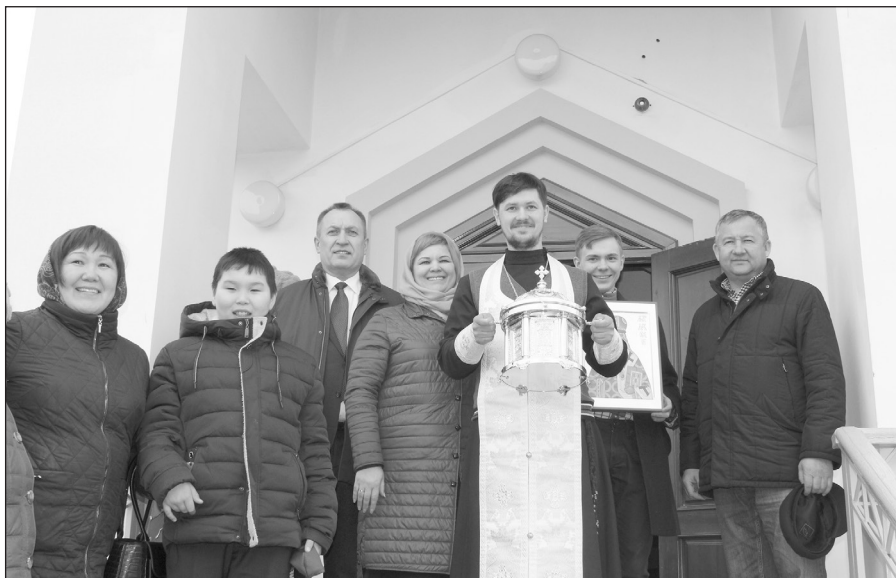
Участники качугской делегации, прихожане у храма в честь Святой Троицы в Усть-Орде

Весь православный мир Иркутской области с не меньшей радостью принял факт прибытия частицы мощей святого на родину. Участников делегации встречали в аэропорту Иркутска православные христиане, представители власти, журналисты. Весь день ларец с частицей мощей перемещался из часовен в храмы, праздничные молебны состоялись в Иркутске, Хомутово, Усть-Орде, Баяндае. Народ шёл приложиться к святыне. Благодаря поддержке администрации района, частью большо-